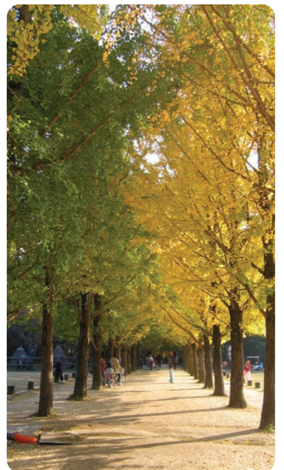
남이섬 은행나무 길